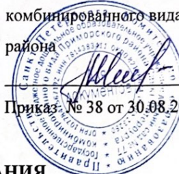
ГРАФИК ВЫДАЧИ ПИТАНИЯ в ГБДОУ детский сад № 77 Приморского района Санкт-Петербург (Оптиков 49/3)