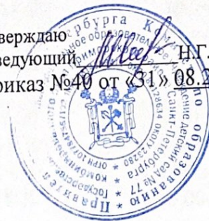
ГРАФИК КВАРЦЕВАНИЯ ПОМЕЩЕНИЙ ГБДОУ д/с №77 Оптиков 49/3