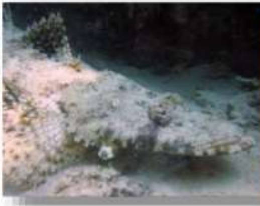
Рыба - крокодил

Морские рыбы имеют очень разнообразную форму и окраску