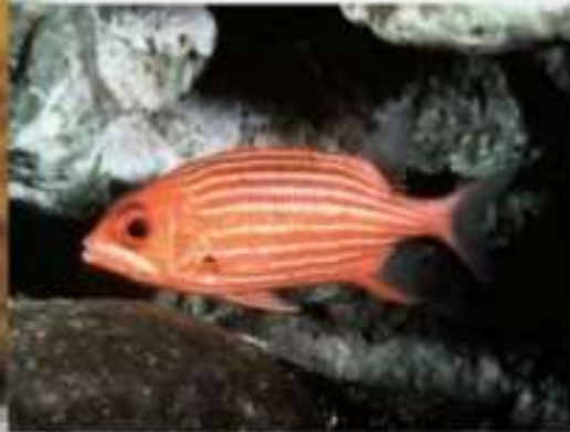
Рыба - белка