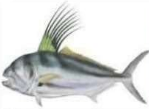
Рыба - павлин