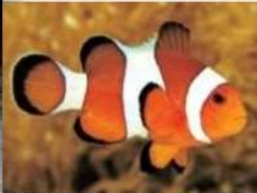
Рыба - клоун