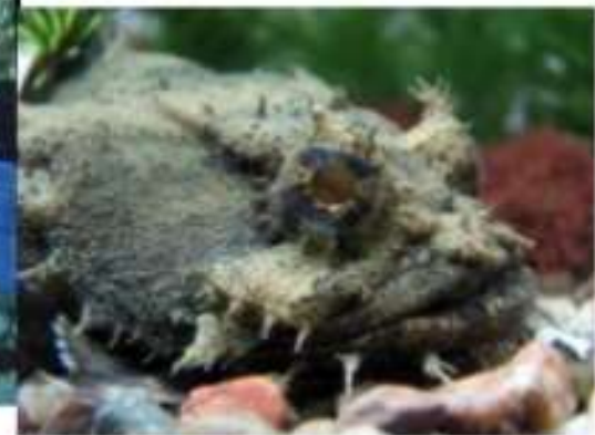
Рыба - жаба