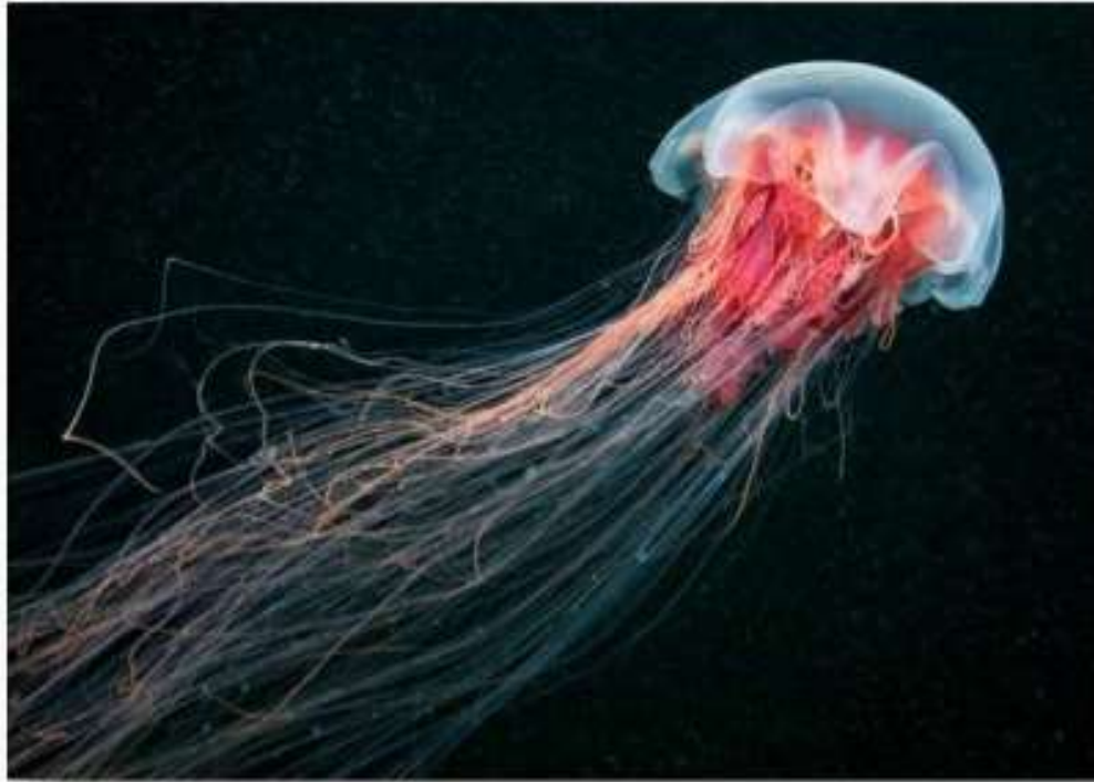
Цианея (львиная грива)

Медуз нельзя трогать руками. Они могут обжечь, т.к. в щупальцах находится яд