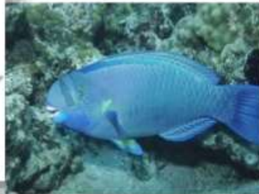
Рыба - попугай